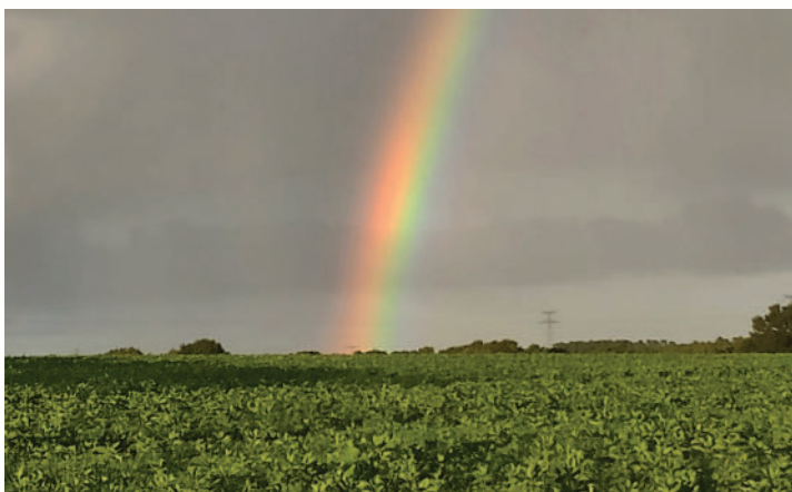
L'arc-en-ciel, témoin du passage d'Iris. Et invitation à la rêverie, à la poésie, à l'observation de la nature.

idées, des produits, des recettes, des techniques. Vous êtes riches de vos apprentissages, vous recelez des trésors en vous, les autres aussi. Voyager, ce n'est pas seulement partir, on peut très bien voyager en restant sur sa terrasse, avec un bon livre (dit Mme Badoul) ou une belle personne.