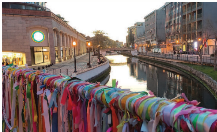
Sur la rambarde du pont qui traverse la Ria de Aveiro, les amoureux accrochent des rubans de couleur avec leurs initiales

Aveiro est une cité touristique, très colorée, car les maisons sont décorées avec des mosaïques. Les visiteurs découvrent la ville en se promenant sur des bateaux, un peu comme des gondoles.