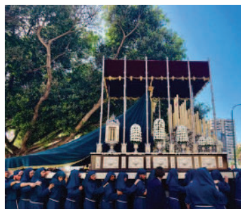
Char traditionnel de la procession de la Semaine Sainte