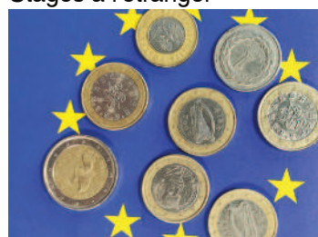
Lycée hôtelier Sainte-Thérèse

Euros ou zlotys : pour voyager à travers l'Europe.