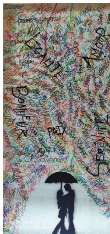
La fresque lauréate.

Le Feuilleté de Canard n°30 - Juin 2023 - page 3