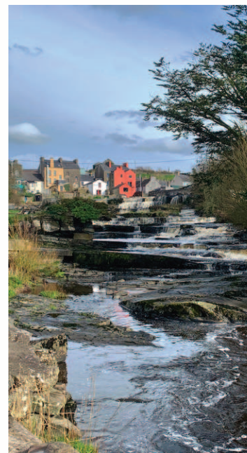
Les chutes de l'Inagh